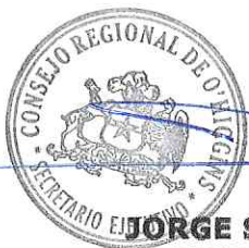
JORGE SAN MARTIN LEYTON SECRETARIO EJECUTIVO CONSEJO REGIONAL REGIÓN DE O'HIGGINS